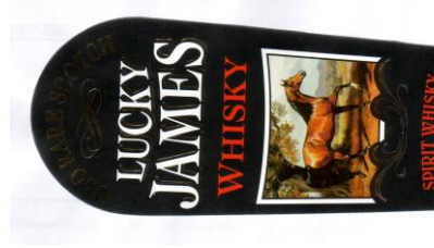
Marque N° 54642 Marque querellée

Mais attendu que compte tenu des ressemblances visuelles, phonétique et intellectuelle prépondérantes par rapport aux différences entre les signes des deux titulaires pris dans leur ensemble; il existe un risque de confusion pour le consommateur d'attention moyenne qui n'a pas simultanément les deux marques sous les yeux ni à l'oreille à des temps rapprochés,