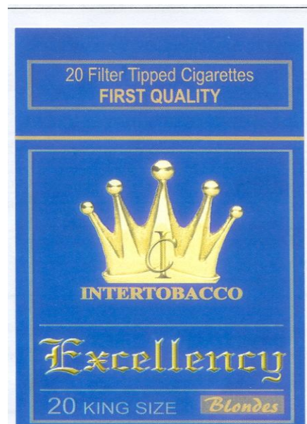
Marque N° 53485 Marque querellée