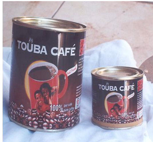
Marque n° 59705 Marque du déposant

Attendu que du point de vue visuel et intellectuel, il existe un risque de confusion entre les marques des deux titulaires, prises dans leur ensemble, se rapportant aux produits de la classe 30, pour le consommateur d'attention moyenne n'ayant pas les marques sous les yeux en même temps, ni à l'oreille à des temps rapprochés,