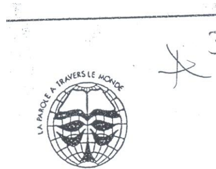
Marque n° 30431 Marque de l'opposant

Attendu que compte tenu des ressemblances visuelles et intellectuelles prépondérantes entre les marques n° 30431 de l'opposant et celle n° 57596 du déposant prises dans leur ensemble, se rapportant aux services identiques de la classe 41 et aux services similaires de la classe 41 de l'opposant et des classes 38 et 42 du déposant, il existe un risque de confusion pour le consommateur d'attention moyenne n'ayant pas les deux marques sous les yeux en même temps,