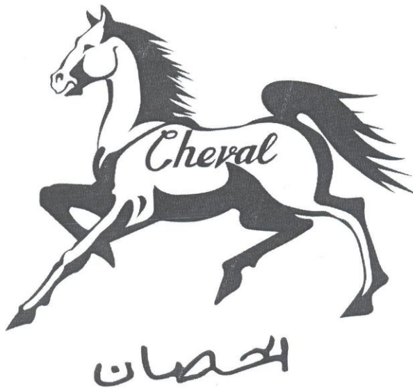
Marque n° 67830 Marque de l'opposant

Attendu que les marques les plus rapprochées des deux titulaires en conflit se présentent ainsi :