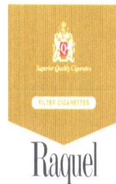
Marque n° 69050 Marque du déposant

Attendu que la société EXPLOSAL LIMITED n'a pas réagi dans les délais à l'avis d'opposition formulée par les sociétés PHILIP MORRIS PRODUCTS SA & PHILIP MORRIS BRANDS SARL, que les dispositions de l'article 18 alinéa 2 de l'Annexe III de l'Accord de Bangui sont donc applicables,