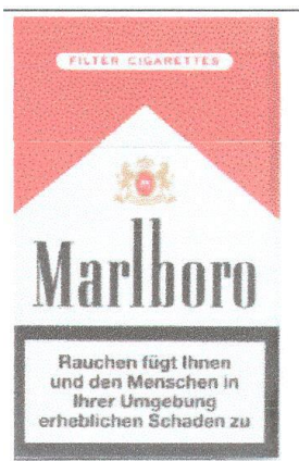
Marque n° 15605 Marque de l'opposant

Attendu que les marques les plus rapprochées des deux titulaires en conflit se présentent ainsi :