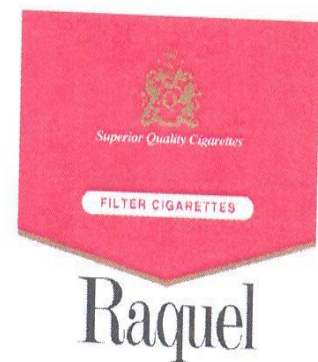
Marque n° 69051 Marque du déposant

Attendu que la société EXPLOSAL LIMITED n'a pas réagi dans les délais à l'avis d'opposition formulée par les sociétés PHILIP MORRIS PRODUCTS SA & PHILIP MORRIS BRANDS SARL, que les dispositions de l'article 18 alinéa 2 de l'Annexe III de l'Accord de Bangui sont donc applicables,