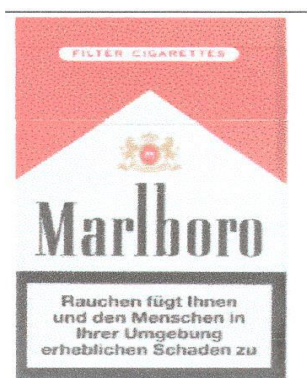
Marque n° 15605 Marque de l'opposant

Attendu que les marques les plus rapprochées des deux titulaires en conflit se présentent ainsi :