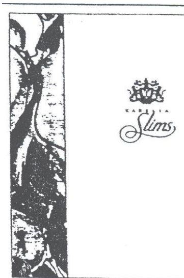
Marque n° 35813 Marque de l'opposant

Attendu que les marques des deux titulaires en conflit se présentent ainsi :