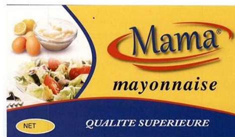
Marque n°77798 Marque du déposant »