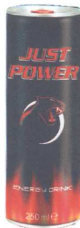
Marque n° 87091 Marque du déposant