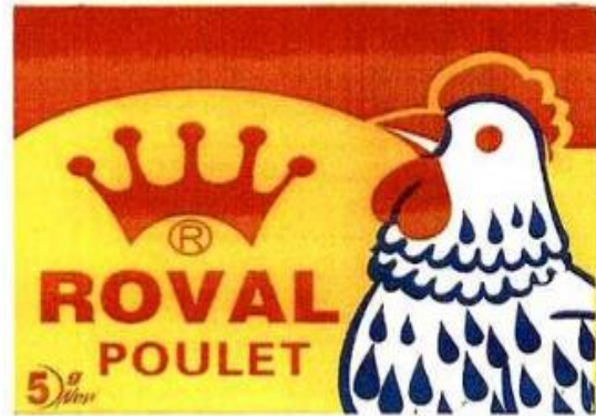
Marque n° 74449 Marque du déposant

Attendu que compte tenu des différences visuelle et phonétique prépondérantes (les deux coqs ont une apparence différente, plumage blanc pour l'un, plumage tacheté pour l'autre, les éléments verbaux sont différents – « JUMBO POULET TOMATE » de l'opposant et « ROVAL POULET » du déposant), par rapport aux ressemblances, il n'existe pas de risque de confusion entre les marques des deux titulaires, prises dans leur ensemble, se rapportant aux produits identiques et similaires des classes 29 et 30, pour le consommateur d'attention moyenne, qui n'a pas les marques sous les yeux en même temps, ni à l'oreille à des temps rapprochés ;