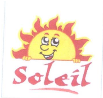
Marque n° 65198 Marque de l'opposant