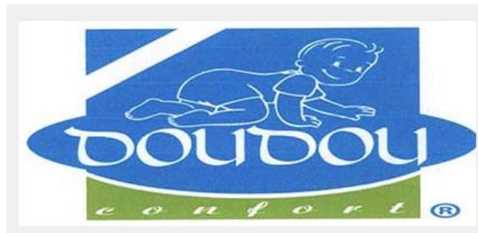
Marque n° 76505 Marque du déposant

Attendu que du point de vue phonétique (reprise de l'élément verbal et déterminant « DOUDOU » de la marque antérieure) et intellectuel (« DOUDOU » et l'image du bébé), il existe un risque de confusion entre la marque « DOUDOU » n° 76613 de l'opposant avec la marque « DOUDOU CONFORT + Logo » n° 76505 du déposant prises dans leur ensemble, se rapportant aux produits identiques de la même classe 3, et aux produits similaires de la classe 3 de la marque de l'opposant avec ceux de la classe 5 de la marque du déposant, pour le consommateur d'attention moyenne qui n'a pas les deux marques sous les yeux en même temps ,